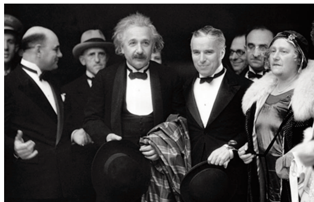
Chaplin med Albert Einstein.