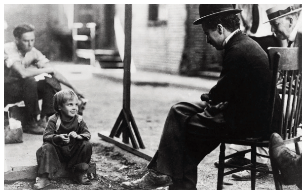
Chaplin regisserar Jackie Coogan i "Chaplins pojke".