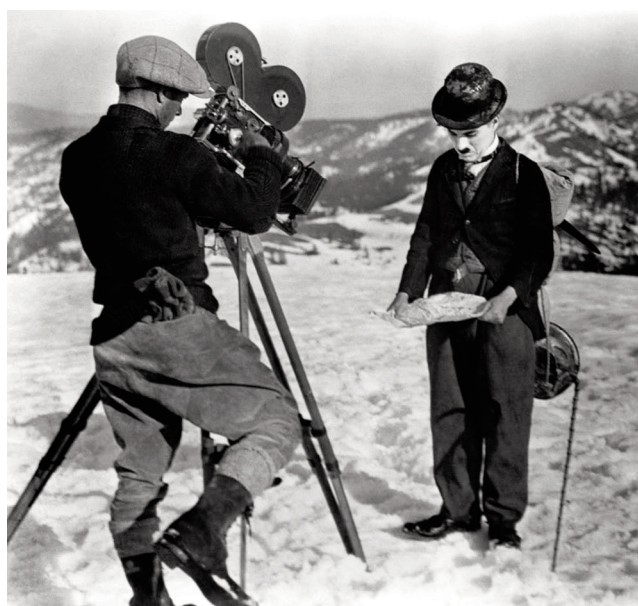
Under inspelningen av "Guldfeber".

riär som springpojke, pappershandelbiträde, betjänt, gatuförsäljare och glasblåsare innan han engagerades i den vid den här tiden enormt livaktiga varieté- och musical-branschen. 1908 anställdes han i Fred Karnos turnerande skådespelartrupp där Sydney redan hade jobb och när truppen 1911 reste till USA blev Charlie kvar på andra sidan Atlanten.