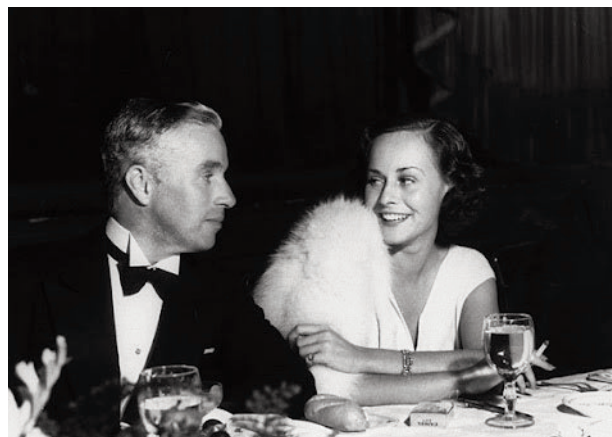
Chaplin med sin fru, skådespelerskan Paulette Goddard.

konstaterande som han återkommer till i en klassisk scen från fabriken i "Moderna tider": för att effektivisera löpande bandet testas en matningsmaskin med vars hjälp