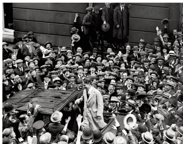
Vart han kom drog Charlie Chaplin stora folkmassor.

skap med å ena sidan en fattig, blind blomsterförsäljerska, å andra sidan en självmordsbenägen miljonär som bara vill veta av sin nye vän när han är kraftigt berusad. Den lille luffaren gör vad som helst för pengar, som han i sin tur ska ge till den blinda flickan, och förnedrar sig gång efter annan. Han tigger, han plockar hästspilling på gatorna, han ställer upp i en uppgjord boxningsmatch som han förlorar på knockout. Men som i alla Chaplins filmer förlorar han aldrig sin värdighet som människa: han vinnlägger sig om att hans klädtrasor ska se så propra ut som möjligt, han promenerar längs gatorna med rak rygg och han uppträder gentlemannamässigt mot sina medmänniskor. Den självmordsbenägne miljonären, däremot, framstår i sin slösaktighet, nyckfullhet och gränslöshet som en människa som helt förlorat sin inre värdighet och ersatt den med en ytlig, ekonomisk dito. För honom är dollar den enda valuta som gäller, och det värde livet räknas i.