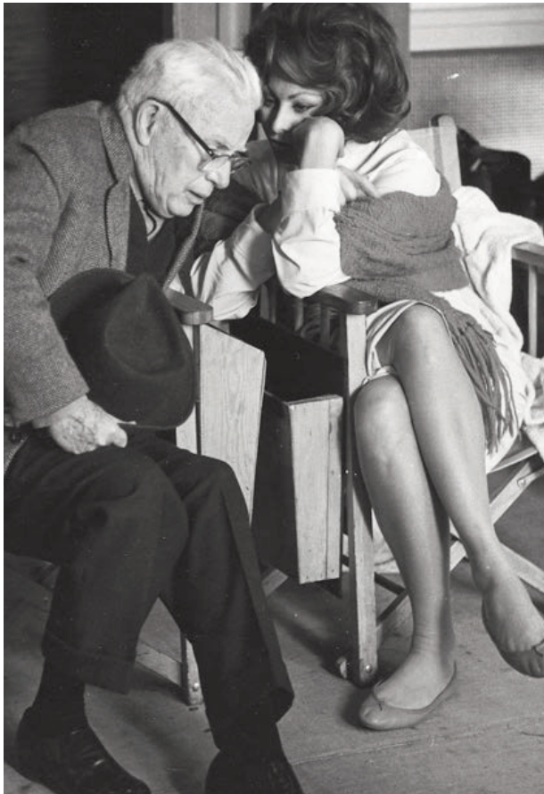
Chaplin viskar med italienska megastjärnan Sophia Loren.