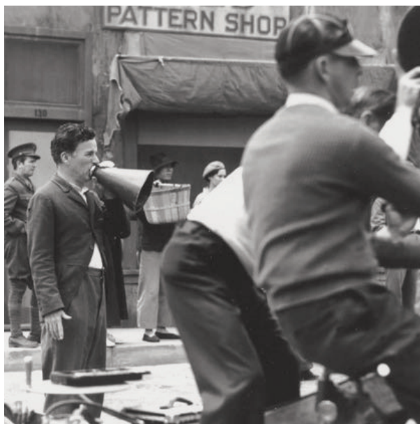
I regitagen med "Diktatorn".