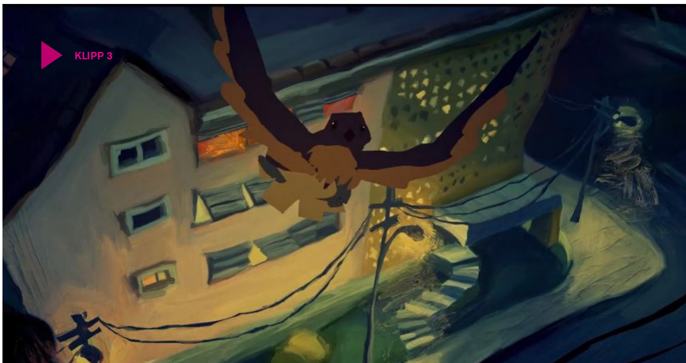
Klipp 3