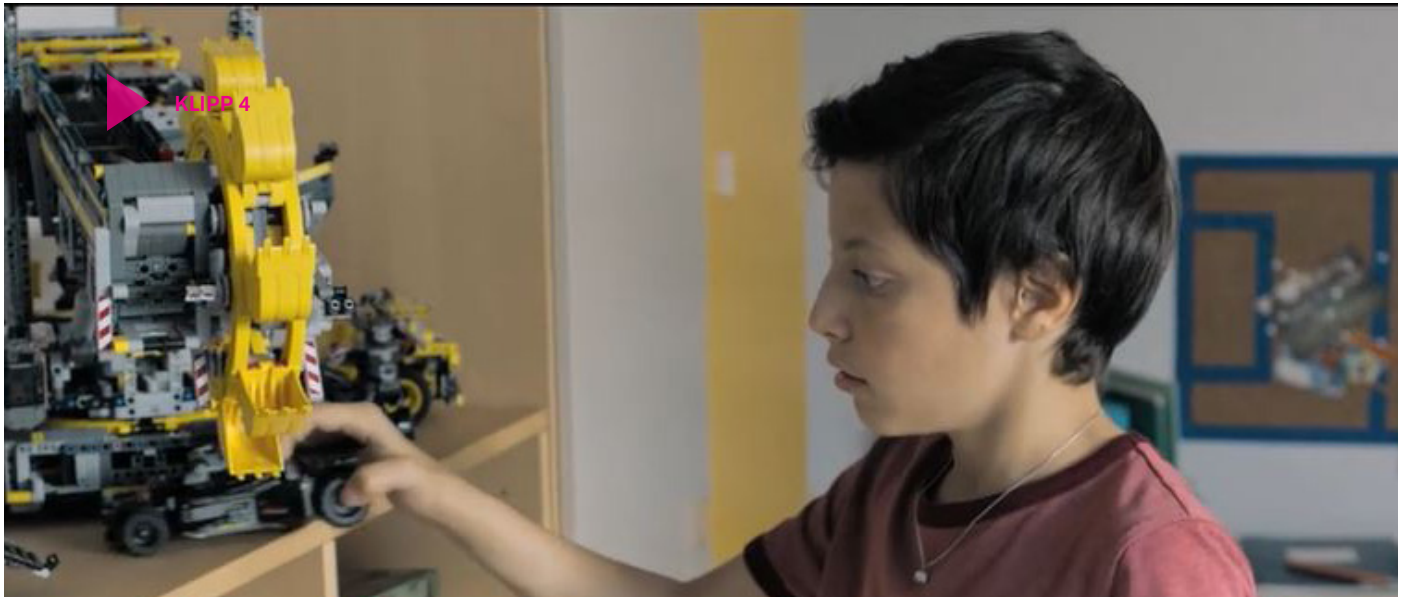
Klipp 4