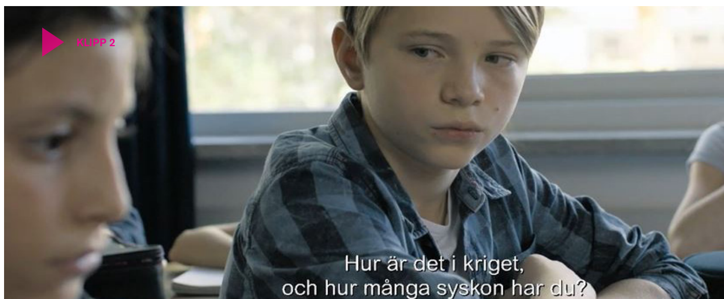
Klipp 2