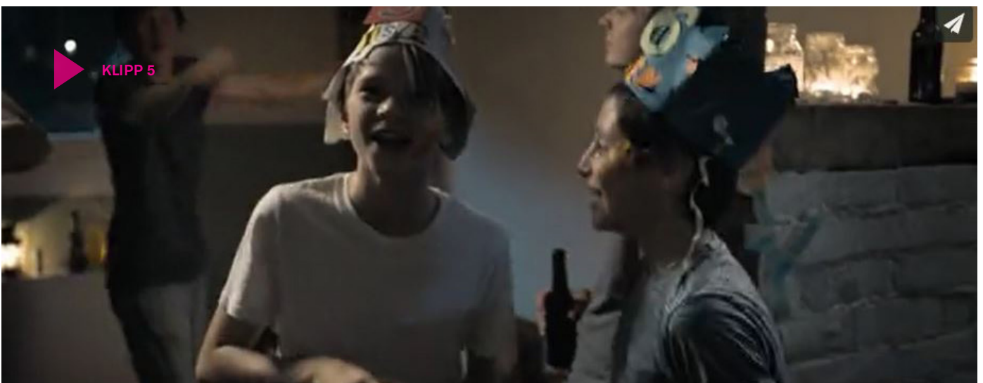
Klipp 5