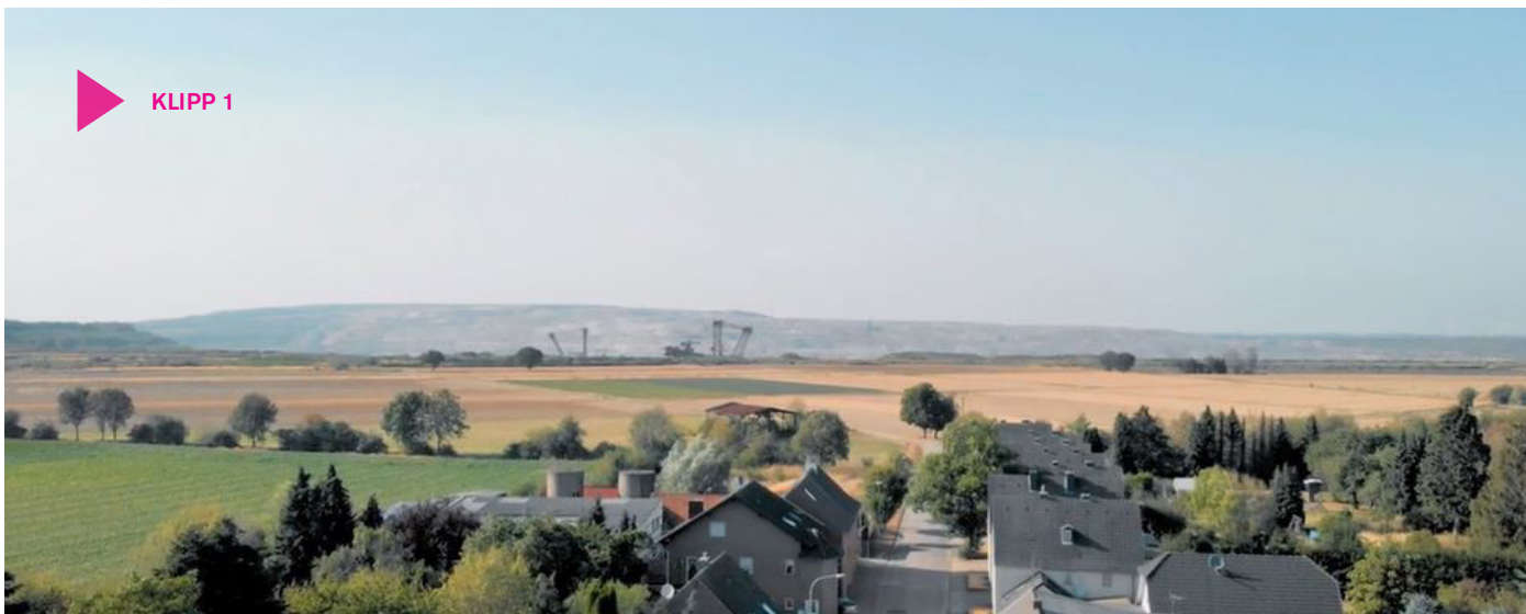
Klipp 1