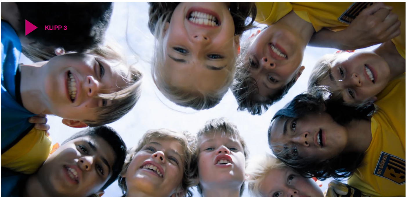
Klipp 3