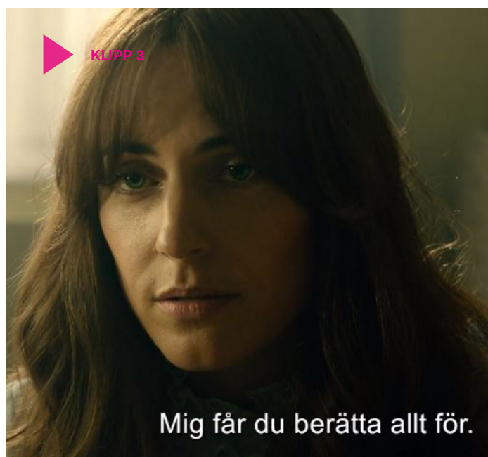
Klipp 3