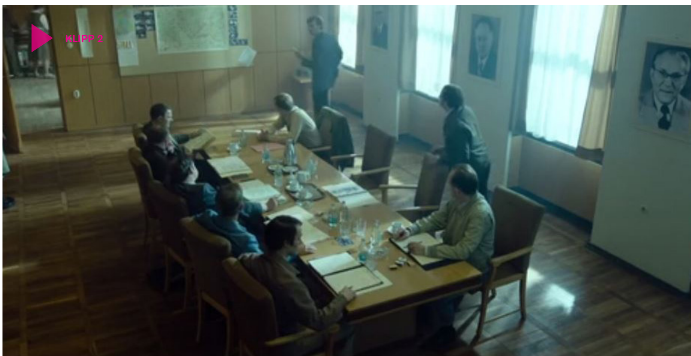
Klipp 2