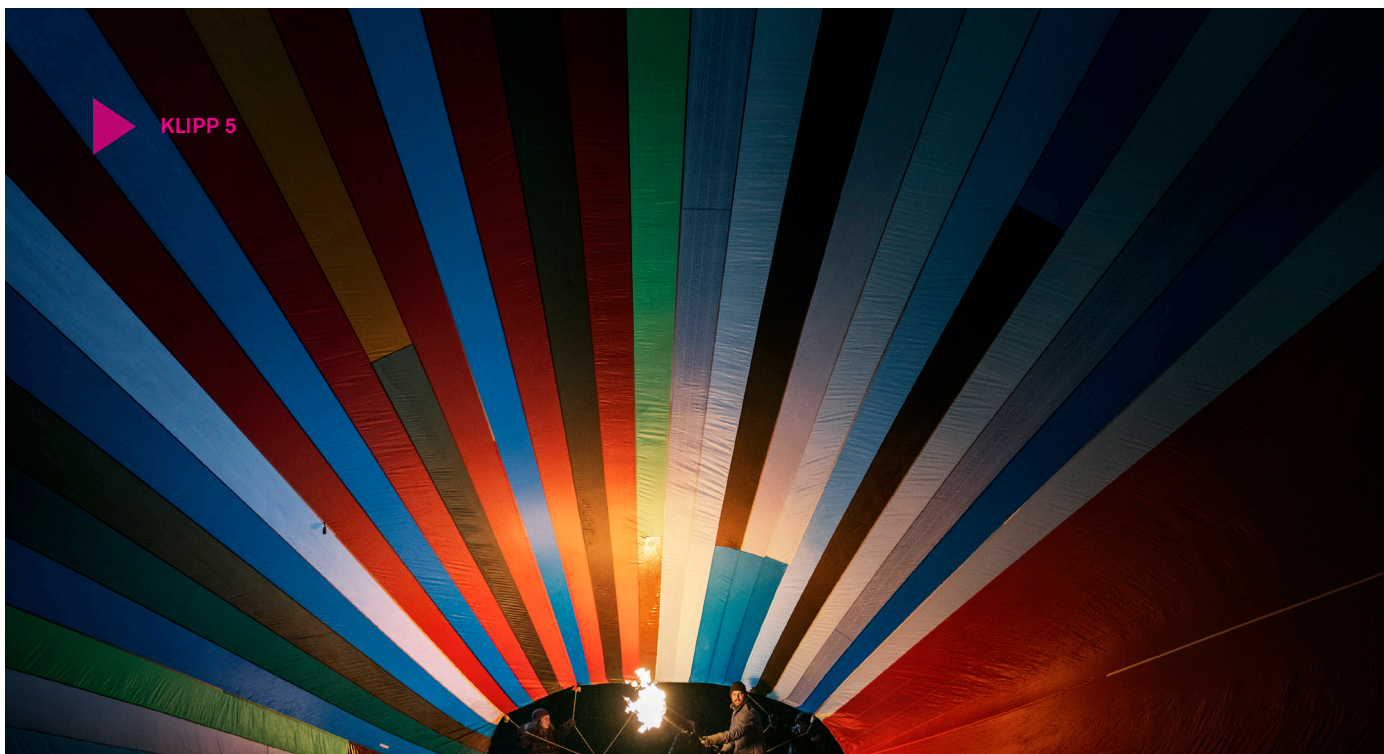
Klipp 5