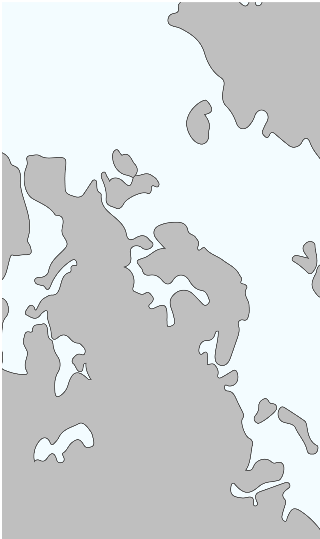
Europakarta utan gränser